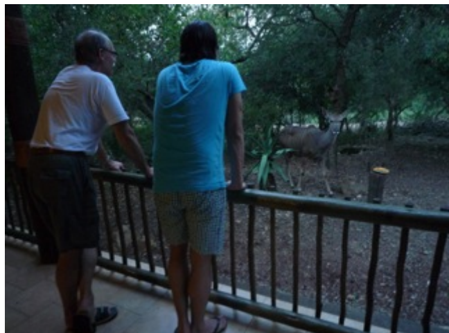
Mhofu en kudu